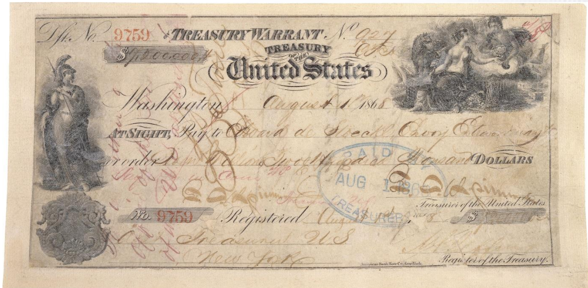
De cheque waarmee de aankoop werd gedaan, Te zien in de Federal Hall in New York

Alaska is de grootste staat van de Verenigde Staten, met een oppervlakte van 1.481.347 km 2 is Alaska ongeveer even groot als Spanje, Frankrijk, Duitsland en de Benelux samen, maar het heeft maar 800.000 inwoners. Alaska was Russisch gebied. Het land werd op 30 maart 1867 door het keizerrijk Rusland verkocht aan de Verenigde Staten voor 7,2 miljoen US dollars (nu ongeveer 120 miljoen), Alaska werd een 'incorporated territory' in 1912 en op 3 januari 1959 werd het de 49 e staat van de USA.